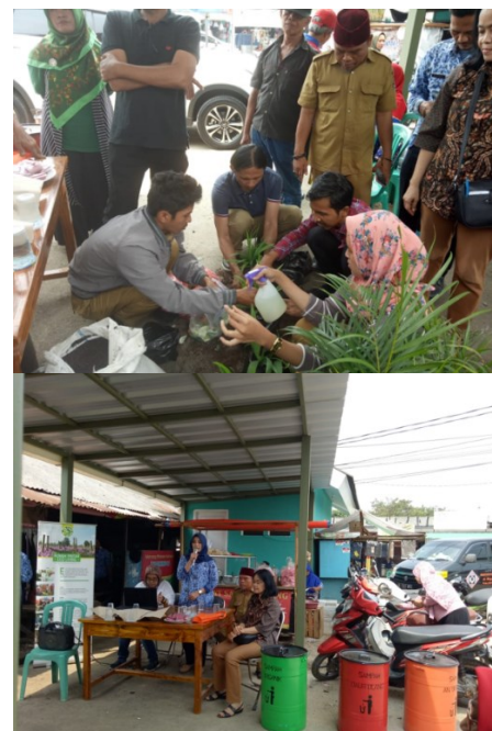
Gambar 2.3. Pelatihan penanaman pohon dengan media sampah organik

Dalam kegiatan Abdimas di pasar jengkol tersebut tim juga dibantu Rumah Pintar Eco Living ITI, melakukan pelatihan penanaman langsung diatas sampah organik dengan Teknologi Mikrobial yang lebih sederhana karena tidak usah nunggu jadi kompos, bagi pedagang pasar dan pengurus Bank Sampah