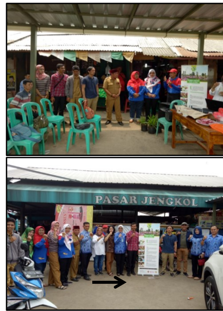
Gambar 2. : Peresmian Pendirian Bank Sampah Pasar Jengkol Resik