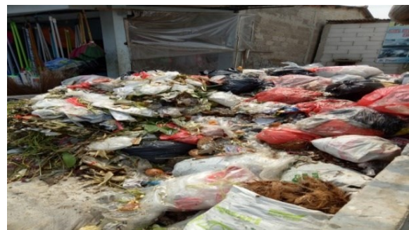
Gambar 1. TPS di pinggir jalan raya Pasar Jengkol

Permasalahan yang ditemukan saat survei di lokasi, beberapa permasalahan yang ditemukan pada mitra, diantaranya di Pasar Jengkol belum ada penanganan masalah sampah pasar yang menumpuk di pinggir jalan, yang menebar bau dan pemandangan tumpukkan sampah di pinggir jalan. Dinas Perindustrian dan Perdagangan, Pemkot Tangerang Selatan mencanangkan bahwa di seluruh pasar harus ada Bank Sampah tapi sampai saat ini Pasar Jengkol juga belum memiliki Bank Sampah.