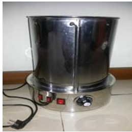
Tampak Samping: Keseluruhan alat dengan kontrol suhu

Selain itu, Evaporator Ultrasonik juga dilengkapi dengan pemanas ( heater ) dan kontrol suhu yang dapat digunakan pada pengolahan lainnya, misalnya proses sterilisasi, pasteurisasi bahan pangan, dan yoghurt incubator, seperti ditunjukkan pada Gambar 1.