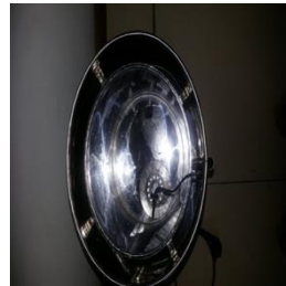
Tampak Atas: Ruang pengolahan dan penggetar ultrasonik