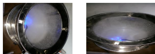
Gambar 2. Selama Proses Penguapan Air

Selama proses penguapan air tanpa sari kurma dan penguapan air pada perlakuan evaporasi sari kurma ditunjukkan pada gambar 2 dan 3.